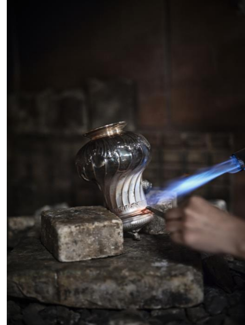
© Mélissa Marischael – par Julie Limont Mémoire de savoirs

Un comité scientifique, composé de spécialistes en formation, culture et économie, encadrera l'étude pour définir son périmètre et guider XERFI Specific dans la méthodologie. Les résultats attendus dès 2024 aideront à anticiper les défis et à orienter les stratégies pour le développement durable du secteur.